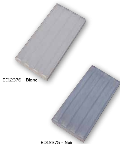
ED12376 - Blanc