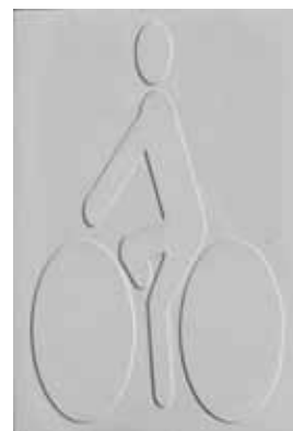
ED12140 - Blanc ED12141 - Noir