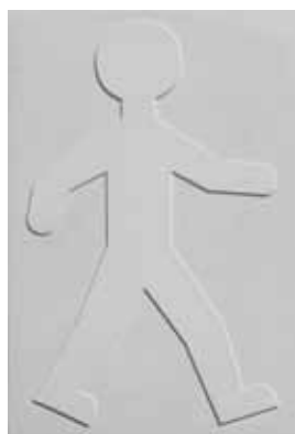
ED12138 - Blanc ED12139 - Noir