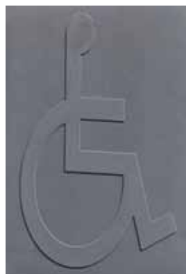
ED12142 - Blanc ED12143 - Noir